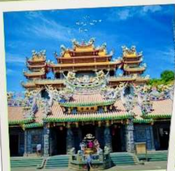
วัดกวนตุ๋