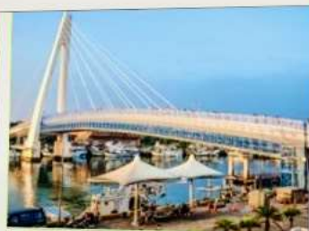
สะพานคู่รักตั้นสุ่ย