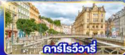
คาร์โรวัวร์