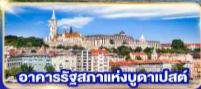
อาคารรัฐสภาแห่งบูดาเปสต์