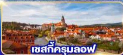
เซสท์ครุมลอฟ