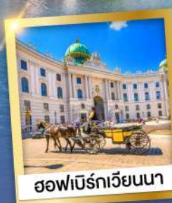
ฮอฟบัวร์กเวียนนา