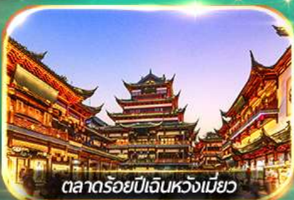
ตลาดร้อยปีเดินหวังเหมียว