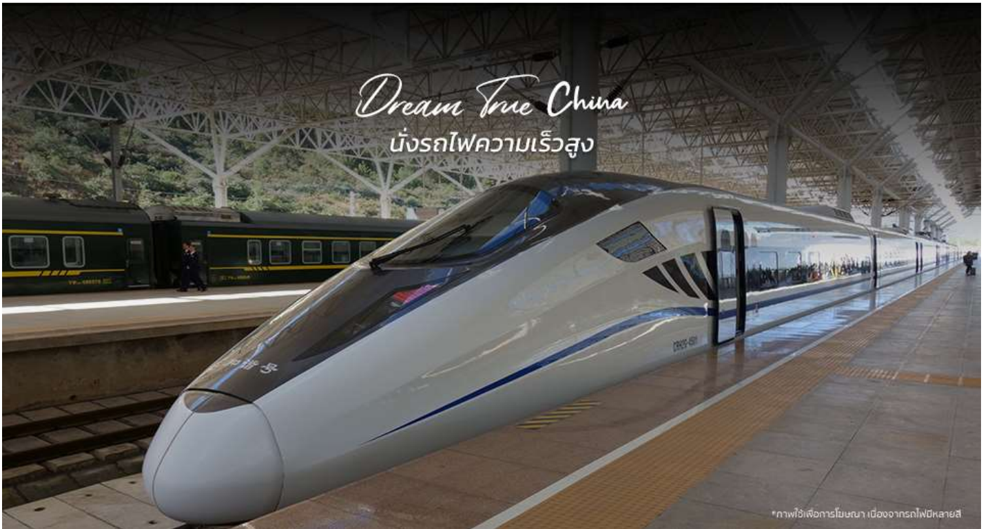
*ภาพไว้เพื่อการโฆษณา เนื่องจากรถไฟมีหลายสี

**ขบวนรถไฟอาจมีการเปลี่ยนแปลง** หมายเหตุ: เพื่อความสะดวกในการเดินทางของท่าน ทางบริษัทฯจะนำกระเป๋าดำเดินทางของท่านขึ้นรถบัส โดยท่านถือเฉพาะสิ่งของสำคัญ และจำเป็นขึ้นรถไฟความเร็วสูงเท่านั้น รถบัสจะนำกระเป๋าดำเดินทางของท่านไปจัดเตรียมไว้ที่โรงแรม