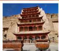
ถ้ำม่อเถา