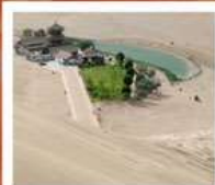
เป็นทรายหมิงซาซาน