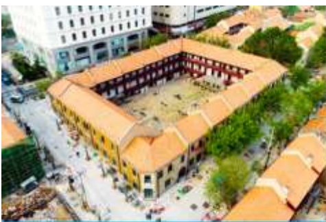
เมืองเก่าเยอรมัน ตรอกกว้างซิงหลี่

จากนั้นนำท่านเดินเที่ยวชม ถนนจงซาน 中山路 ถนนที่เต็มไปด้วยกลิ่นอายยุโรป และถนนสายนี้มีบันทึกเรื่องราวมากกว่าศตวรรษของเมืองชิงเต่าไว้ ที่นี่เป็นศูนย์กลางการค้าแห่งแรกที่เต็มไปด้วยสถาปัตยกรรมสไตล์ยุโรปเก่าแก่ที่ได้รับอิทธิพลมาจากเยอรมัน ให้ท่านได้เดินเก็บบรรยากาศ และ เก็บภาพกับ โบสถ์เซนต์ไมเคิล (ด้านนอก) โบสถ์แห่งนี้ที่คู่รักนิยมมาถ่ายภาพงานแต่งงานมากที่สุดในเมืองชิงเต่า ให้ท่านถ่ายรูปเก็บภาพ