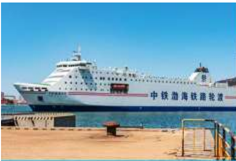
เรือ ZHONGTIE BOHAI CRUISE