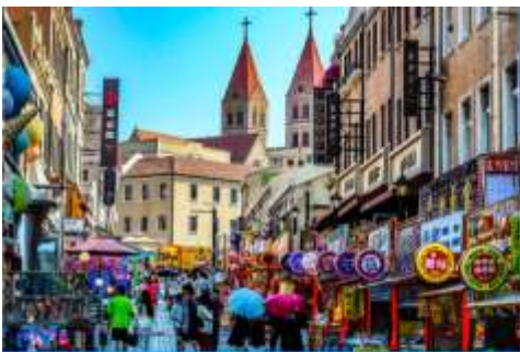
ถนนววงซาน

หลังอาหารนำท่านเดินทางชม สะพานจ้านเจียว 栈桥 เป็นแลนด์มาร์คแห่งประวัติศาสตร์คู่เมืองชิงเต่า สร้างเมื่อปี ค.ศ.1891 มีลักษณะเป็นสะพานหินทอดยาวกว่า 440 เมตรสู่ทะเล ปลายสะพานมีศาลา ทรงแปดเหลี่ยมสีแดงที่โดดเด่น ซึ่งเป็นสัญลักษณ์บนฉลากเบียร์ชิงเต่า ขึ้นชื่อเรื่องวิวสวย รับลมทะเล ให้ท่านเก็บภาพบรรยากาศ