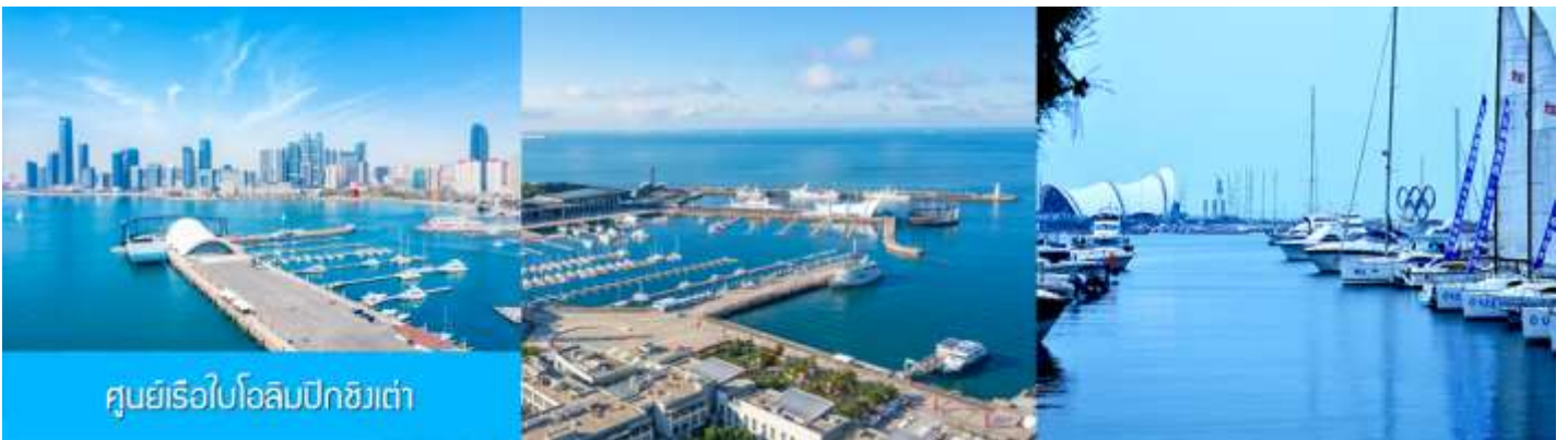
ศูนย์เรือใบโอลิมปิกชิงเต่า

จากนั้นนำท่านเที่ยวชม โรงเบียร์ชิงเต่า 青岛啤酒博物馆 พิพิธภัณฑ์เบียร์ที่ขึ้นชื่อของเมืองชิงเต่า ซึ่งเป็นเบียร์ยี่ห้อแรกที่ผลิตขึ้นในประเทศจีน ชมเบียร์ คอลเลกชั่นที่มียี่ห้อหลากหลายที่สุดของโลก และชมการจัดแสดงภาพและวิดิทัศน์เกี่ยวกับวิวัฒนาการของเบียร์ ขั้นตอนการผลิตและอื่น ๆ ที่เกี่ยวข้อง พร้อมชิมเบียร์ชิงเต่า ซึ่งเป็นเบียร์ที่ขายดีที่สุดในยี่ห้อหนึ่งของจีน.. (ชิมเบียร์ชิงเต่าท่านละ 1 แก้ว รับประทานอีก 1 ขวดเล็ก ตอนเดินออก)