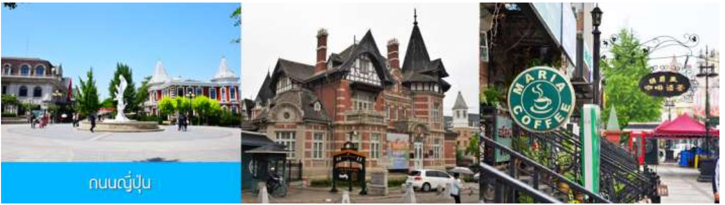
ถนนญี่ปุ่น