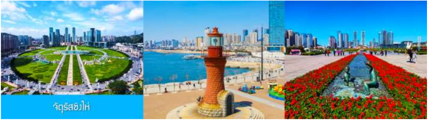
จัตุรัส星海

นำท่านเที่ยวชม จัตุรัส星海 星海广场 เป็นจัตุรัสขนาดใหญ่เป็นแลนด์มาร์คสำคัญของเมืองต้าเหลียน สร้างขึ้นเพื่อเฉลิมฉลองในโอกาสที่รัฐบาลอังกฤษคืนเกาะฮ่องกงในให้จีนในปี ค.ศ. 1997 ตั้งอยู่ชายฝั่งทะเลในเมืองต้าเหลียน เป็นจัตุรัสใจกลางเมืองที่ใหญ่ที่สุดในโลกและเป็นแลนด์มาร์คของเมืองต้าเหลียน รายล้อมด้วยตึกระฟ้าที่ทันสมัย ภายในมีบ่อน้ำพุดนตรี ลานหญ้าขนาดใหญ่ และลานกว้างสำหรับจัดกิจกรรมกลางแจ้ง อาทิ เทศกาลเบียร์นานาชาติ การแข่งขันวิ่งมาราธอน งานแฟชั่นนานาชาติเมืองต้าเหลียน ฯลฯ