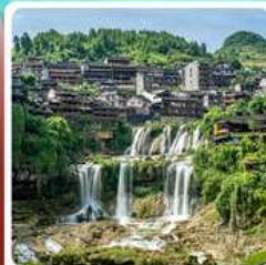
ฝูหรงเจิน