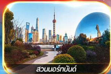
สวนนอร์มัลด์