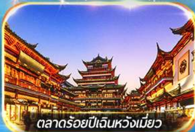
ตลาดร้อยปีเงินหวงเมียว

ถ่ายรูปชมสวนนอร์มัลด์ , เข็มอินหาดไว่กาน, วัดพระหยกขาว อิสระช้อปปิ้งถนนนานกิง POPMART FLAGSHIP STORE