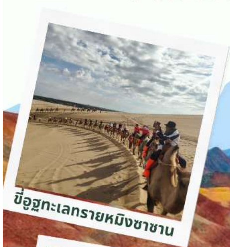
ขี่อูฐทะเลทรายหมิงซาซาน