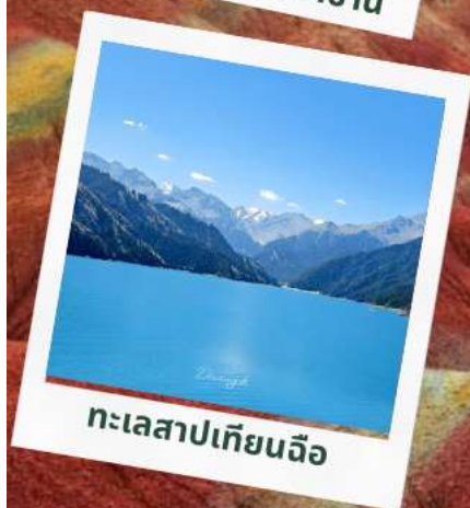
ทะเลสาปเทียนฉือ