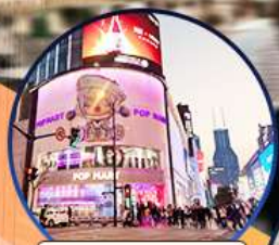
ถนนหนานจิง