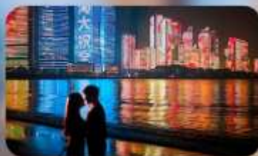
ชายหาดหมายเลข 3