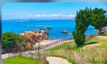
เกาะสี่เหลี่ยมเต่า