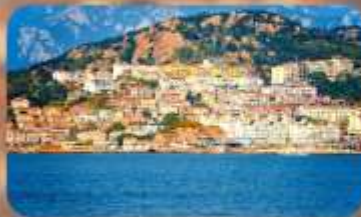
หมู่บ้านชาวประมงชาจื่อโจว