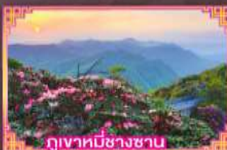
ภูเขาที่มีชาวชน