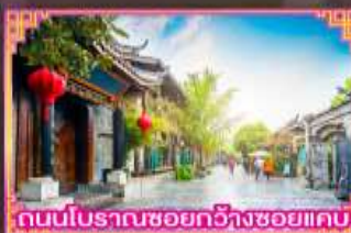
ถนนโบราณซอยกว้างซอยแคบ