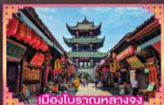
เมืองโบราณหลวงจง