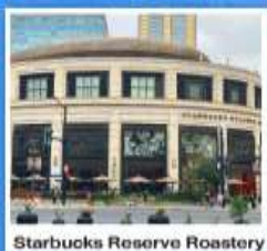
Starbucks Reserve Roastery