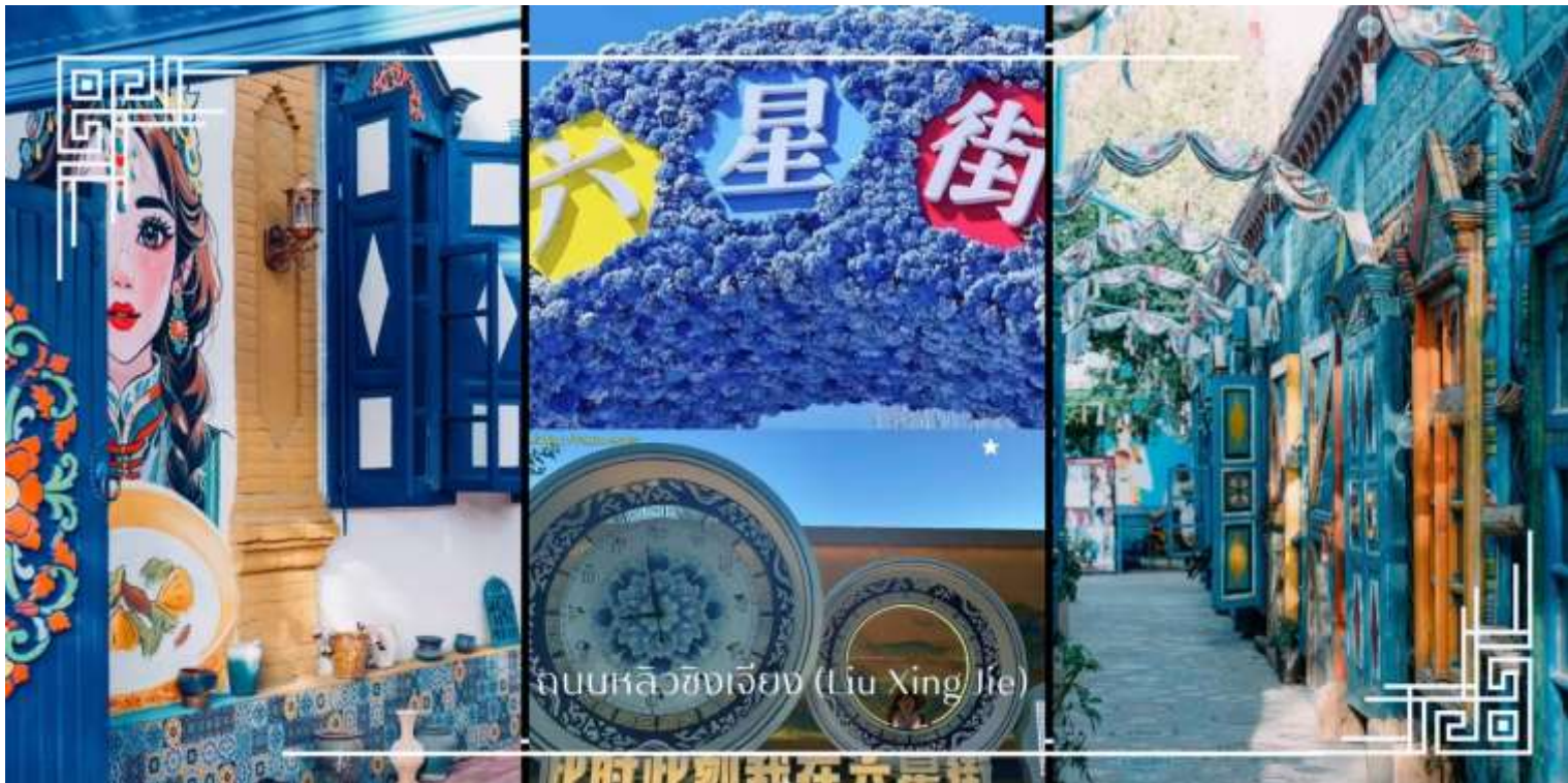
ถนนหลิวซิงเจียง (Liu Xing Jie)

อิสระช้อปปิ้ง ถนนหลิวซิงเจียง (Liu Xing Jie) เมือง อี้หนิง (Yining) ถนนคนเดินที่มีชีวิตชีวาและเต็มไปด้วยสินค้าหลากหลาย เหมาะสำหรับการเดินเล่น ช้อปปิ้ง และสัมผัสบรรยากาศท้องถิ่นอย่างใกล้ชิด สองข้างทางเรียงรายด้วยร้านค้าของฝาก งานหัตถกรรมพื้นเมือง เสื้อผ้า เครื่องประดับ อาหารท้องถิ่น และร้านกาแฟบรรยากาศอบอุ่น โดดเด่นด้วยสถาปัตยกรรมสีสดใสที่ผสมผสานกลิ่นอายยุโรปและเอเชียกลางได้อย่างลงตัว