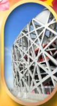
ผ่านชมสนามกีฬาโอลิมปิก