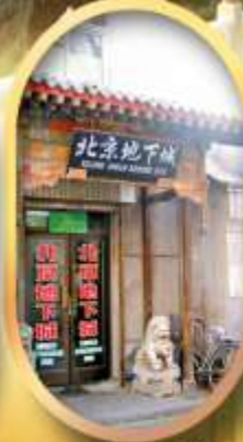
เมืองโบราณใต้ดิน