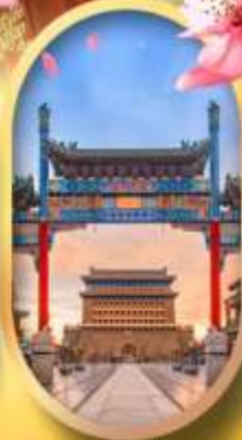
ถนนคนเดินเจียมเหมิน