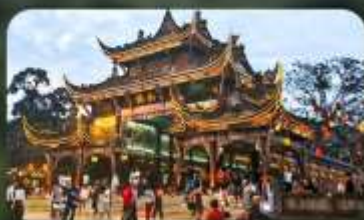
เมืองโบราณกวนเสี้ยน