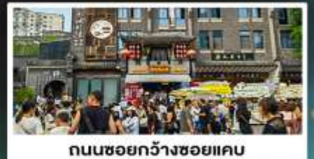
ถนนชอยกว้างชอยแคบ