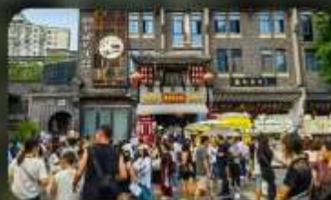
ถนนชอยกวางชอยแคบ