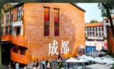
ดงเจียวจี้

HOLIDAY INN EXPRESS HOTEL หรือเทียบเท่า 4 คาว