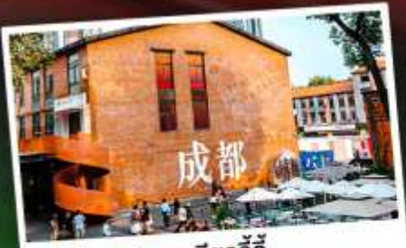
ตงเจียวจี้

เทือกเขาแอลป์แห่งเมืองจีน ชมความงามของ "อุทยานภูเขาซีดรุณี"