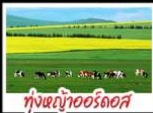
ทุ่งหญ้าเออร์ดอส

ทุ่งหญ้าเออร์ดอส สุสานเจงกิสข่าน แกรนด์แคนยอนแม่น้ำเหลือง