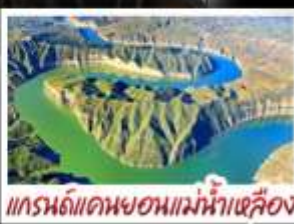
แกรนด์แคนยอนแม่น้ำเหลือง