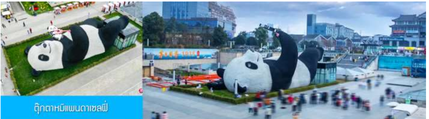
ตุ๊กตาหมีแพนด้าเซลฟี

เที่ยง รับประทานอาหารกลางวัน ณ ร้านอาหารพื้นเมือง (8)