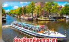
สองเรือหลังคากระจก