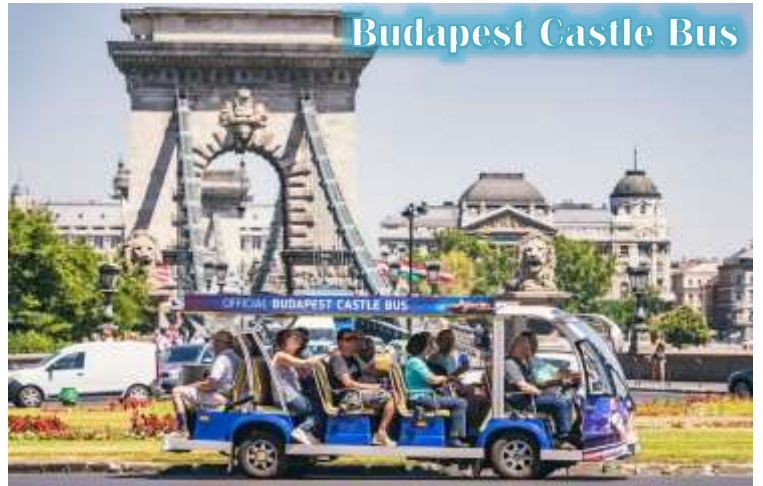
Budapest Castle Bus

บูดา Castle Hill *เนื่องจากตัวปราสาทตั้งอยู่บนเนินเขา การเดินทางโดยรถไฟไฟฟ้า จะเพิ่มความสะดวกสบายให้กับท่าน โดยรถไฟไฟฟ้าจะจอดรับและส่งตามจุดต่างๆ ในย่านเมืองเก่า ไม่ต้องเดินเท้าเป็นระยะทางไกล* จากนั้นนำท่านเดินชมความงดงามของเมืองเก่ารอบๆปราสาทบูดา ที่เริ่มมีการก่อสร้างมาตั้งแต่ปี ค.ศ.1265 และต่อเติมปรับปรุงมาโดยตลอด จนกระทั่งปัจจุบัน โดยตัวอาคารในปัจจุบันเราจะเห็นเป็นสไตล์บาโรค ที่ดู