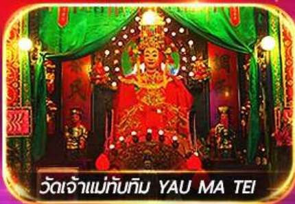
วัดเจ้าแม่ทับทิม YAU MA TEI