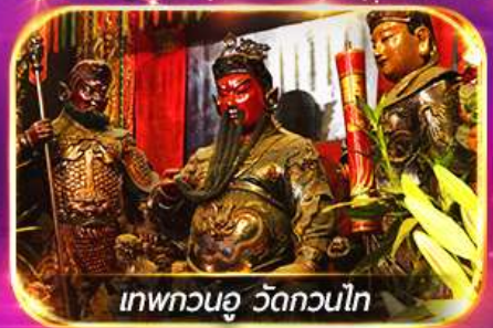
เทพทวนอู วัดกวนไท

พามุไหว้พระขอพร 8 วัดดัง เล่นเครื่องเล่นดิสนีย์แลนด์เต็มวัน ชมพลุสุดอลังการ