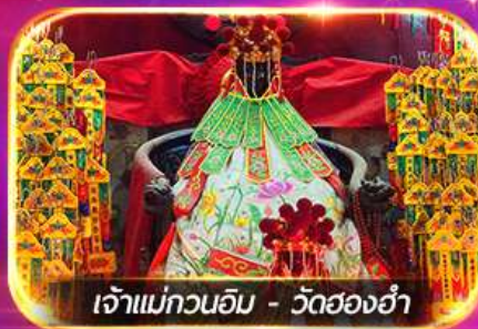
เจ้าแม่ทวนอิม - วัดฮ่องกง