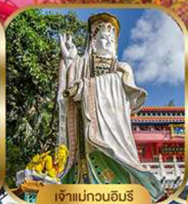
เจ้าแม่กวนอิม พลัสเบย์