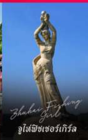
Zhuhai Fighting Girl จูไห่พิชเชอร์เทียร์