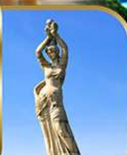
จู๊หลี่ฟิชเชอร์ทรี