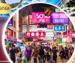
Shopping Tsim Sha Tsui