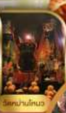
วัดนางไคทง