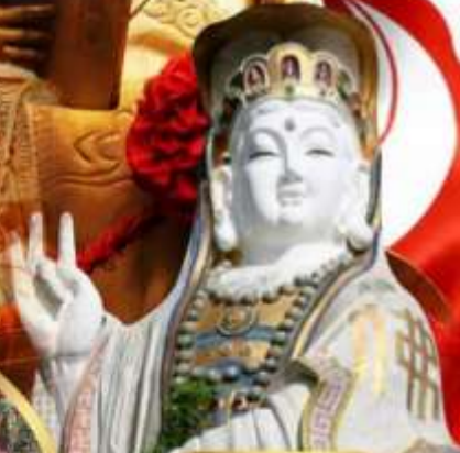
เจ้าแม่กวนอิม ริฟลิสเบย์