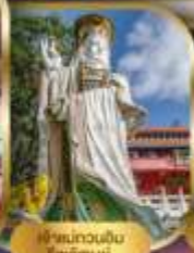
เจ้าแม่กวนอิม ไพลิน