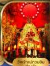
วัดเจ้าแม่กวนอิม ต่งซา