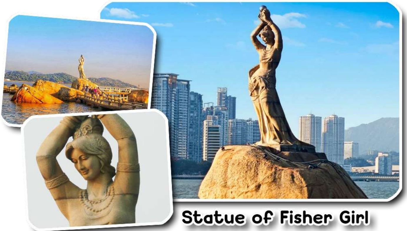
Statue of Fisher Girl

พาท่านชมและถ่ายรูปคู่กับสัญลักษณ์อันสวยงามโดดเด่นของเมืองจูไห่ บริเวณอ่าวเซียงหู “จูไห่ ฟิชเชอร์เกิร์ล” หรือที่มีชื่อเรียกว่า “หวีหนี่” เป็นรูปปั้นนางฟ้าถือไข่มุกสูง 8.7 เมตร ซึ่งยื่นออกไปในทะเล ให้ท่านชมถนนคู่รักเป็นถนนซึ่ง อยู่ริมชายหาด ที่ทางรัฐบาลจูไห่ได้ตกแต่งภูมิทัศน์ได้อย่างสวยงามเหมาะสำหรับ พักผ่อน