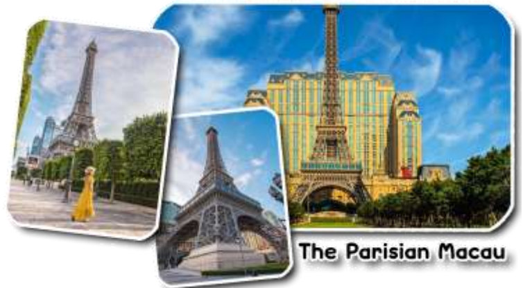
The Parisian Macau

และนำท่านชม The Parisian Macao (เดอะปารีสเซียน มาเก๊า) เป็นอีกหนึ่งแลนด์มาร์คของมาเก๊าที่ได้ยกหอไอเฟลมาจำลองใจกลางเมือง Cotai Strip โรงแรมแห่งนี้ได้รับแรงบันดาลใจมาจากเมืองปารีส ประเทศฝรั่งเศส นครแห่งศิลปะที่มีความงดงามทางด้านสถาปัตยกรรม ความโดดเด่นของหอไอเฟล กลิ่นอายของความคลาสสิกและความโรแมนติกมาไว้ที่โรงแรมแห่งนี้