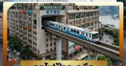
รถไฟฟ้ากะลุดัก