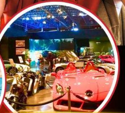
Royal Automobile Museum