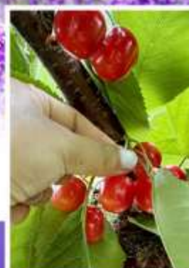
กิจกรรมเก็บเชอร์รี่

ออนเซ็น 2 คืน นน.กระบี่ 23 กก. 1 ใบ 6Days 4Night