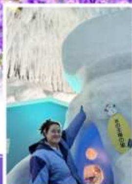
พิพิธภัณฑ์น้ำแข็ง