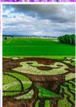
ศิลปะบนทุ่งข้าว