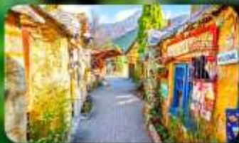
หมู่บ้านยูฟุอิน