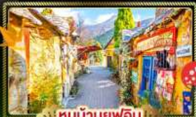
🏠 หมู่บ้านยูฟูอิน