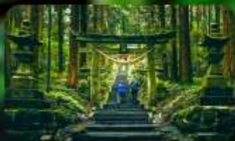
ศาลเจ้าคามิซึกิมิ