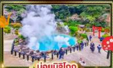
♨️ บ่อน้ำพุร้อน