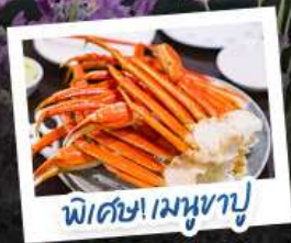
พิเศษ! เมฆงาปู