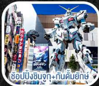
ช้อปปิ้งชินจูกุ+กันดั้มยักษ์