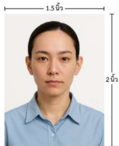
ขนาดรูปตัวอย่างใช้ยื่น Visa

*** ห้ามขีดเขียน แม็ก หรือใช้คลิปลวดหนีกระดาษ ซึ่งอาจส่งผลให้รูปถ่ายชำรุด และไม่สามารถใช้งานได้ ***