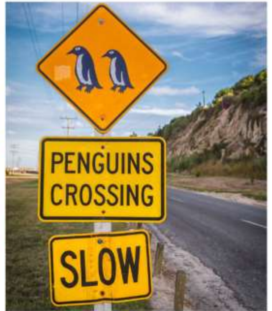
Janara Blue Penguin Colony