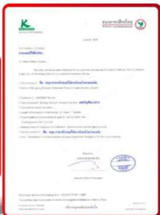
ตัวอย่าง Bank Guarantee ที่ยื่นได้ตรงกับกัมพูชา