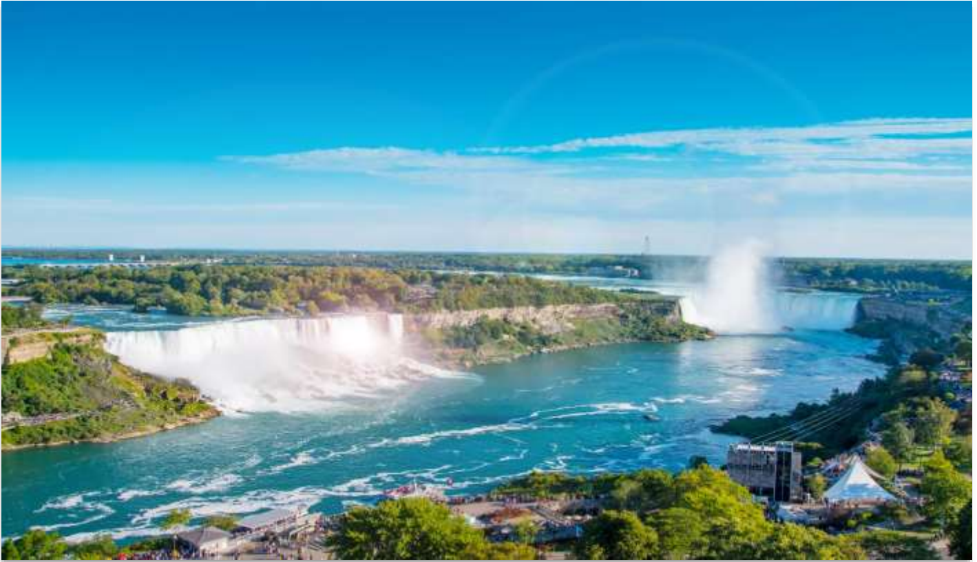
NIAGARA FALLS STATE PARK

นำท่านเดินทางสู่ “อุทยานแห่งชาติไนแอกการ่า” (Niagara Falls State Park) ฝั่งสหรัฐอเมริกา หนึ่งในสิ่งมหัศจรรย์ทางธรรมชาติของโลก ที่ได้รับการยกย่องให้เป็นสถานที่ท่องเที่ยวยอดนิยม และเป็น หนึ่งในสามจุดหมายปลายทางสุดโรแมนติกสำหรับการดื่มด่ำผิงพระจันทร์ของคู่บ่าวสาวชาวอเมริกัน น้ำตกไนแอก