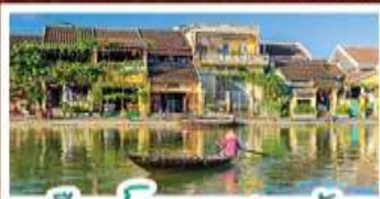
เมืองโบราณเฮงฮัน

! พักบนเขาบาน่าฮิลล์ 1 คืน ! สัมผัสอากาศเย็นตลอดปี สโตร์ฝรั่งเศสสุดคลาสสิก - นั่งกระเช้ายาวที่สุด สู่มานาฮิลล์ สุกสุดมันส์ไปกับสวนสนุก The Fantasy Park นมัสการเจ้าแม่กวนอิมองค์ใหญ่ที่สุดของเมืองดานัง - เช็กอินเมืองมรดกโลกฮอยอัน - สนุกสนานไปกับกิจกรรม!!นั่งเรือกระดิง หมู่บ้านกัมทาน เช็กอินร้านกาแฟ SON TRA MARINA CAFE - ไม่หลงร้านช้อปปิ้ง - อิ่มอร่อยกับบุฟเฟ่ต์นานาชาติ , มือถือไฟสีฟูด