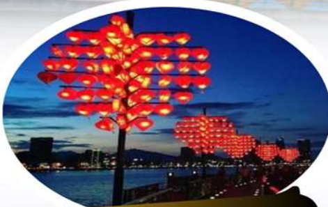
สะพานแห่งความรัก