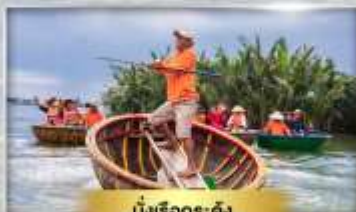
มังเรือกระดัง