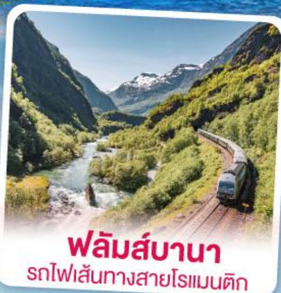
พหลิมส์บานา รถไฟเส้นทางสายโรแมนติก