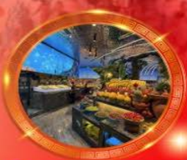
มื้อพิเศษ บุฟเฟต์นานาชาติ