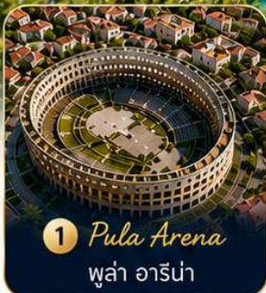
1 Pula Arena ปูลา อาร์น่า