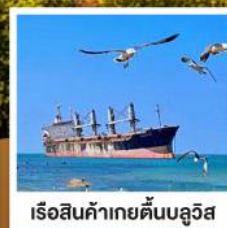
เรือสินค้าเกย์ตันบลูวิส