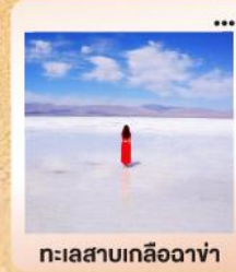
ทะเลสาบเกลือฉ่า