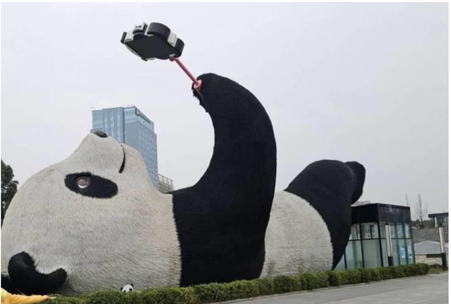
2UTFU-VZ006 เฉิงตู...อุทยานป้าเผิงโกว อุทยานสัตว์ดุหมีแพนด้า Times Outlets Chengdu ร้านหนังสือจงซูเก้อ *ไม่ลงร้านซ้อป* 5วัน 4คืน โดยสายการบิน Thai VietJet Air (VZ)

นำท่านเดินทางชมความน่ารักของ ศูนย์อนุรักษ์หมีแพนด้า เมืองตูเจียงเยียน ศูนย์แห่งนี้เป็นหนึ่งในสถานที่สำคัญด้านการอนุรักษ์และเพาะพันธุ์หมีแพนด้า ซึ่งเป็นสัตว์สงวนหายาก พบเฉพาะในประเทศจีนและมีถิ่นกำเนิดในมณฑลเสฉวน แพนด้ามีลูกยากเพราะอุณหภูมิในร่างกายที่พร้อมจะตั้งท้องมีเพียง 3 วันใน 1 ปี จะตกลูกครั้งละประมาณ 2 ตัว ตัวที่แข็งแรงเพียงตัวเดียวเท่านั้นจะอยู่รอด อาหารโปรดของหมีแพนด้าคือไผ่ลูกศร ระหว่างการเดินทางชมในศูนย์ฯ จะได้เห็นแพนด้าน่ารักหลายตัว นอนคว่ำบ้าง นั่งอิงบ้าง แพนด้าถูกเรียกว่า “สัตว์ประหลาดพลังงาน” ก็เพราะว่าแพนด้าไม่ชอบออกกำลังกาย ทำอะไรก็ช้าๆ ทำที่รู้สึกสบายที่สุดก็คือท่านอนและท่านั่ง แม้อปีนขึ้นไปต้นไม้ ก็อยู่นิ่งๆ บนต้นไม้ได้หลายชั่วโมง