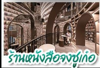
ร้านหนังสือจวงซูเก้อ

อุทยานสี่ดรุณี - อุทยานปู้เผิงโกว - วัดต้าฉือ หมีแพนด้าบนเชลฟี - ร้านหนังสือจวงซูเก้อ ถนนโบราณชวยกวางชวยแคบ ซอปปิงถนนไท่กู่หลี่ + ถนนชุนซู่ CHENGDU TIMES OUTLETS