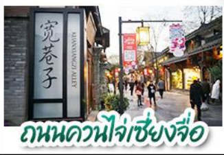
ถนนควานี้จ่าเซียงซือ