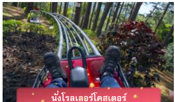
นั่งโรลเลอร์โคสเตอร์