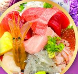
ตลาดปลาชิบิสึ คาชิโนะอิชิ