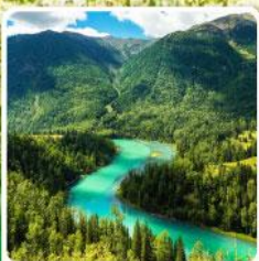
ทะเลสาบคานาสือ