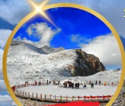
OPTIONAL TOUR ชารน้ำแข็งต้ากู่ปิงชวณ

NO SHOPPING ไม่เข้าร้าน ช้อปปิ้ง เที่ยวเต็มสุข 成都