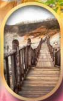
หุบเขาจิกุกุคาบิ