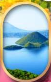
วิวทะเลสาบโทยะ