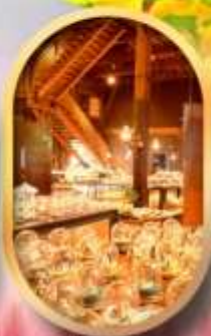
พรมกันทักล่องดนตรี