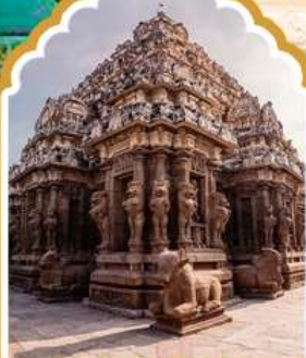
กาญจัปรัม