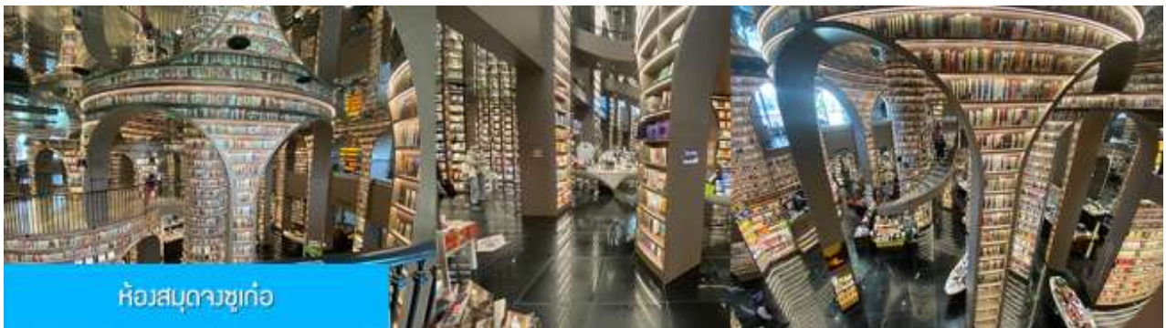
ห้องสมุดจซูก่อ