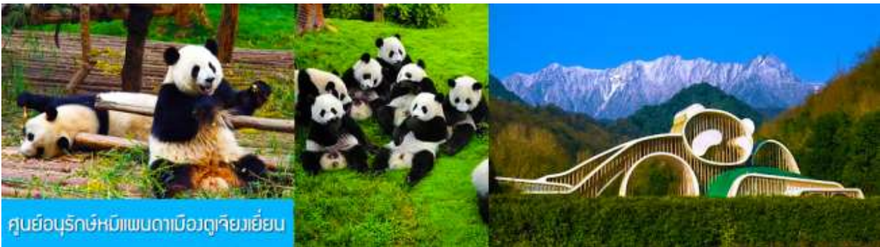
ศูนย์อนุรักษ์หมีแพนด้าเมืองตูเจียงเย็น

เช้า รับประทานอาหารเช้า ณ ห้องอาหารของโรงแรม (7) หลังอาหารท่านสามารถเลือกที่จะซื้อโปรแกรมทัวร์เสริม หรืออิสระพักผ่อนตามอัธยาศัยในโรงแรม