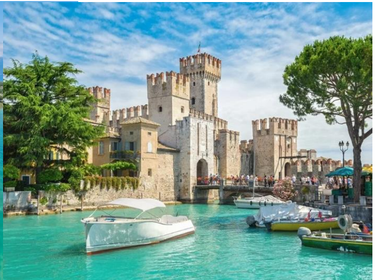
กลางวัน อิสระอาหารกลางวันตามอัธยาศัย