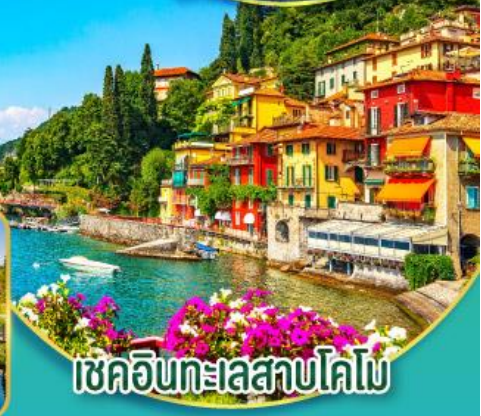
เชคอินทะเลสาบโดโลไมท์